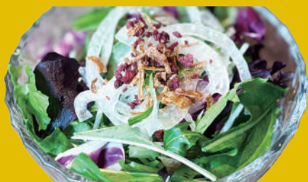
オリジナルフレンチドレッシング