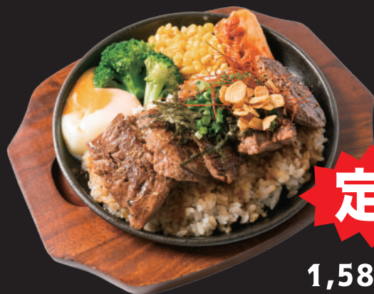
鉄板ハラミ スタミナライス (スープ付)