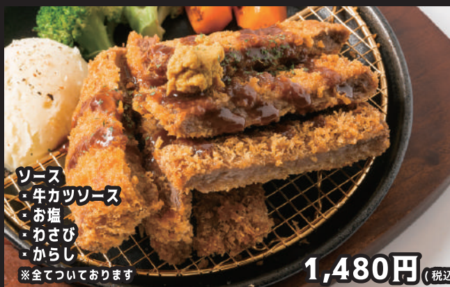
ハラミ牛カツ (スープ付)