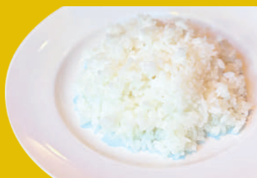
こだわりの国産米を使用しております