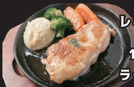
桜姫鶏のチキンステーキ (スープ付)