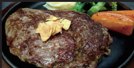
リブローズステーキ (スープ付)